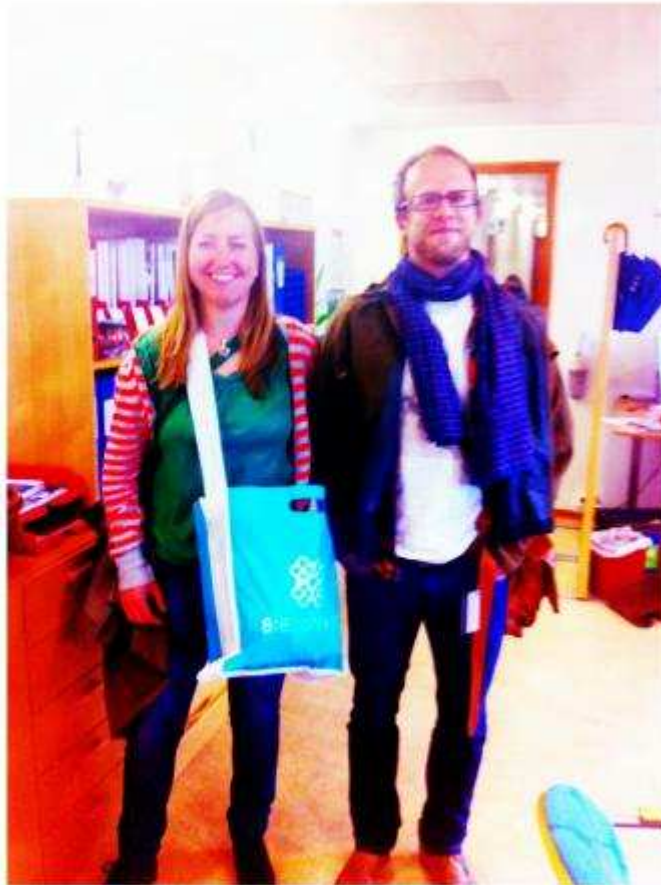
Kolleger på vandring

passer godt teknisk, det blir de fleste iPhonebildene mine. Jeg bare gjør det enda litt mer amatørmessig og knytter fram det jeg synes er fine bilder med ulike fotoapper. Jeg mente også å vite at stemning teller, og at det er fint med bilder som viser oss, hvem vi er og hvordan vi jobber sånn i det daglige. Og så tenkte jeg at det tror jeg har noe å si for de som leser sida vår. At de ser hvem vi er sånn litt utenom seminar/møte og kurssettinger.