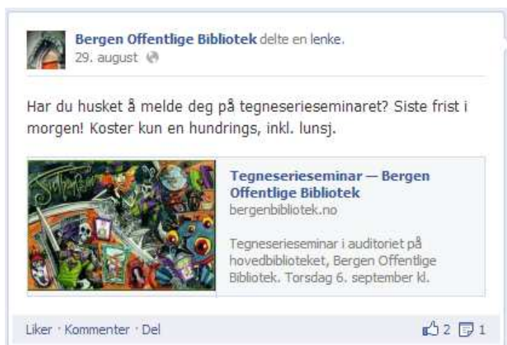
Tegneserieseminar ved Bergen offentlige bibliotek

I noen tilfeller er innleggene til Bergen delt videre. Et av disse er innlegget om tegneserieseminar ved biblioteket. Innlegget er en påminnelse til potensielle deltakere om å huske å melde seg på til arrangementet. Ordet “hundrings” er brukt i stedet for “hundre kroner”, eller “en hundrelapp”. Jeg vil anta at “hundrings” kanskje er en måte å tilrettelegge språket slik at det treffer målgruppa for seminaret bedre.