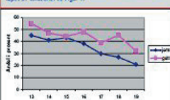
Figur 1: Andel som er medlem i idrettslag, for hver aldersalder i termalene. Figuren er basert på tall fra Ung i Norge undersøkelsen 2002 (Årnes og Skarstad, 2004: 34).

De som 'laster' investerer mye tid, penger og energi i idrett; og alternativet er ofte at man slutter, som også mange gjør i laget av termalene. Se Figur 1.