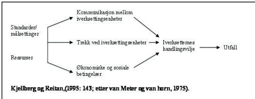
Figur 2: Implementeringsteorien til van Meter og van Horn (1975).

En tolkning av hvorfor aktiviteten til Alfred ble lagt ned, kan baseres på teorier om implementering. En modell fra klassisk statsvitenskap, om implementering (van Meter & van Horn, 1975; forenklet i Kjellberg & Reitan, 1995: 143), kan her være fruktbar. Modellen skisserer hvordan implementeringsprosessen er. Den begynner med politikkdannelsen, der mål defineres og ressurser avsettes. Deretter, i midten av figuren (se Figur 2), finnes tre sett med filtreringsvariabler. Disse er (i) økonomiske og sosiale rammebetingelser, (ii) trekk ved implementeringsenhetene, og (iii) kommunikasjon mellom implementeringsenhetene.