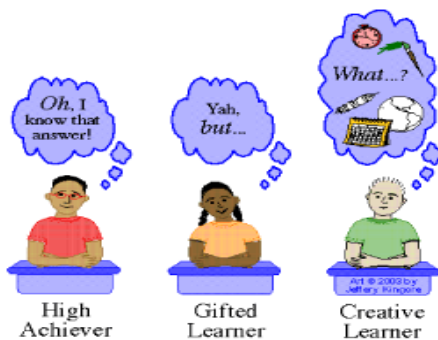
Response to a Question

Det andre bildet viser elevenes tanker når de er klare til å svare.