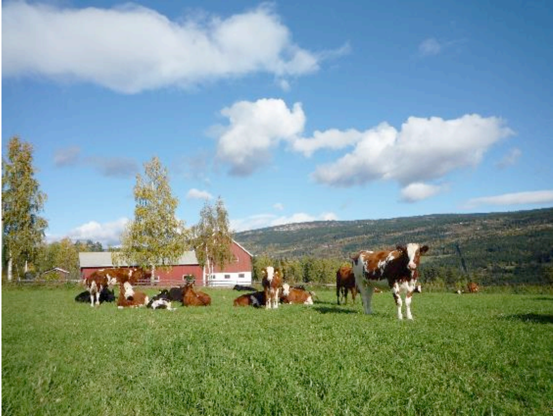
Storfe på innmarksbeite.