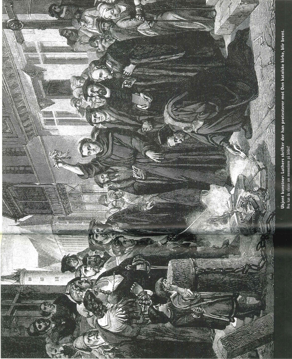
Ukjent kunstner: Luthers skrifter der han protesterer mot Den katolske kirke, blir brent. Hva kan du (lese) om menneskene på bildet?