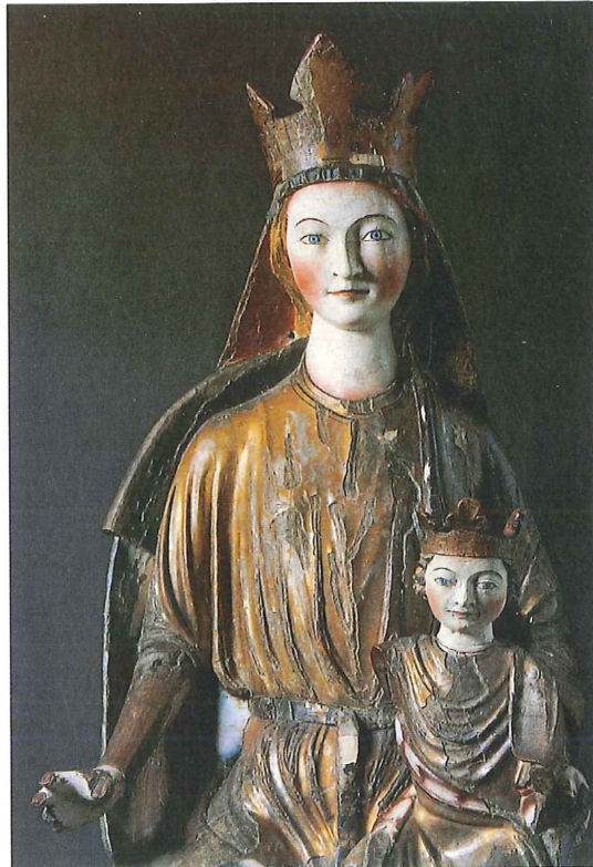
Jomfru Maria med barnet, utformet på 1200-tallet. Fra Hedalen stavkirke i Valdres.

VISSTE DU AT ritualene omkring døden både var viktige og omfattende i katolsk tradisjon? Noe av det folk savnet etter reformasjonen, var at den som skulle dø, ble salvet med hellig olje på pannen. Etter dødsfallet var «sjelemessen» et viktig katolsk ritual. Det var en gudstjeneste for å hjelpe den døde sjel hjem til Gud.