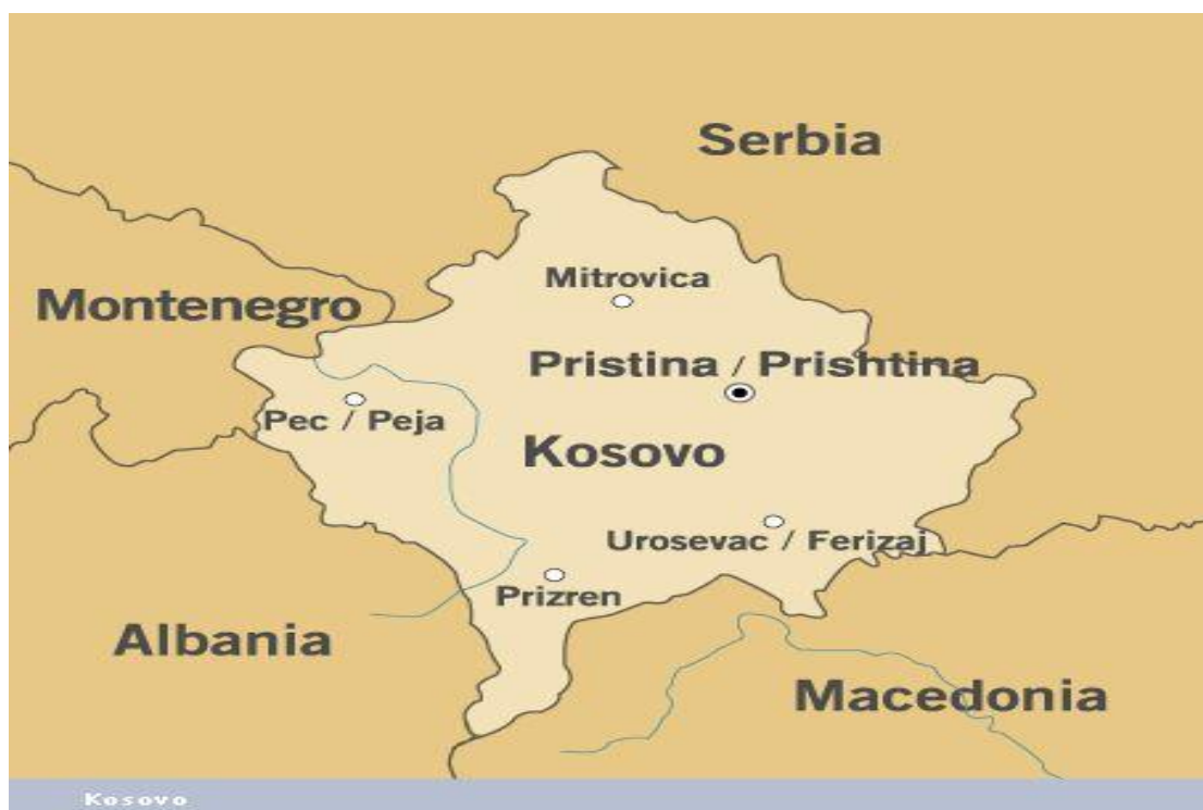
Figur 1: kart fra Kosovo, ( http://www.globalis.no/Land/Kosovo :27.01.2015)

Religion: islam, romersk-katolsk kristendom og serbisk-ortodoks kristendom