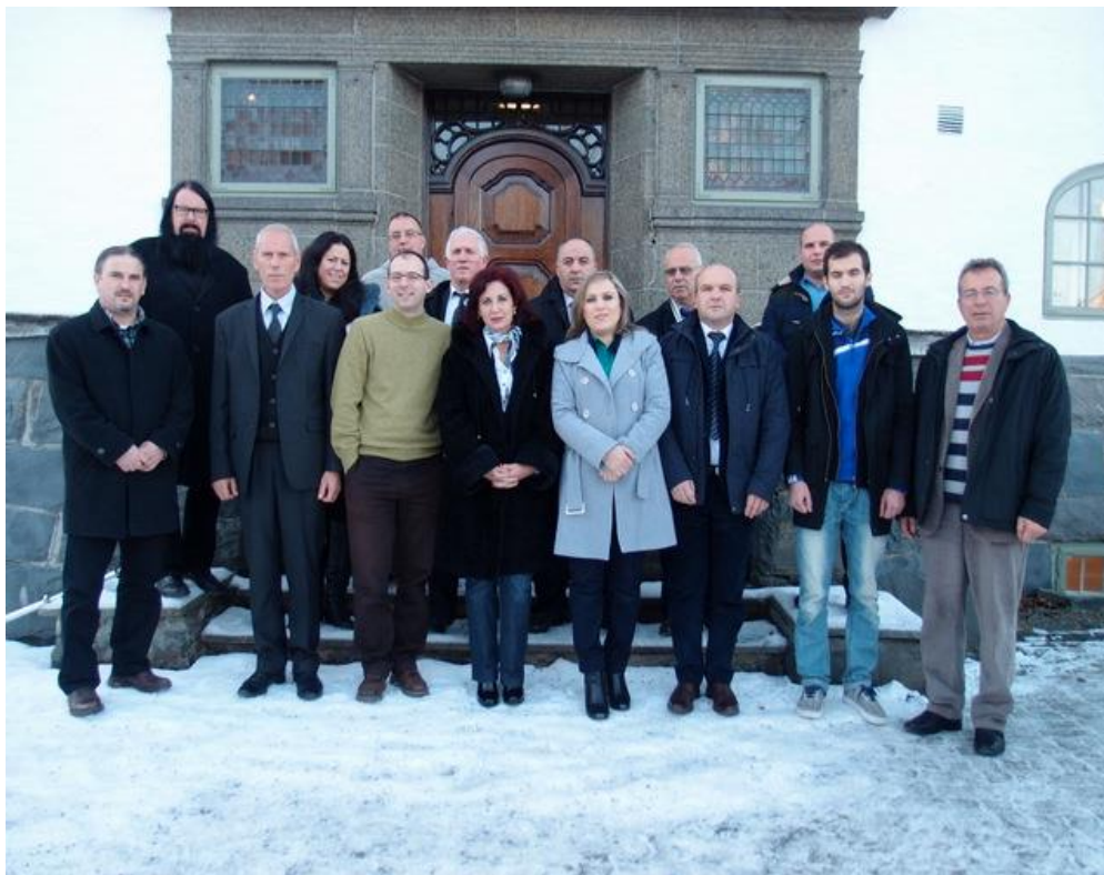
Fig. 3, bilde av delegasjon fra Kosovo på Lillehammer ( http://www.peace.no/images/stories/pdf/dialoghefte.pdf )

Lignende bilder som dette bildet av delegasjoner fra Kosovo var det mange av i møterommet til Nansen Fredssenter. Dette bildet er hentet fra nettsidene til Nansen fredssenter. Det var mange forskjellige mennesker fra forskjellige verdensdeler, som Nansen Fredssenter jobber med i arbeid om fred og forsoning.