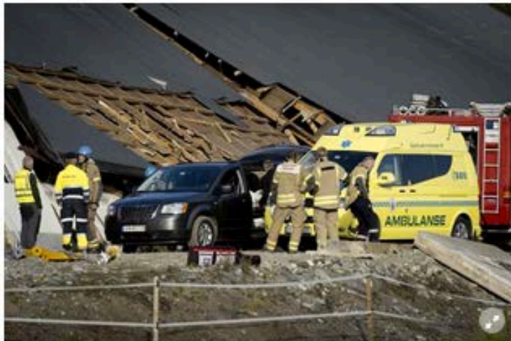
Den savnede mannen ble funnet omkommet i det sammenraste fjøset.

TIPS GGR TLF.: 977 21 000 MAIL: TIPS@GD.NO MMS/SMS: GDTIPS + MLD TIL 2470 SEND VIDEO