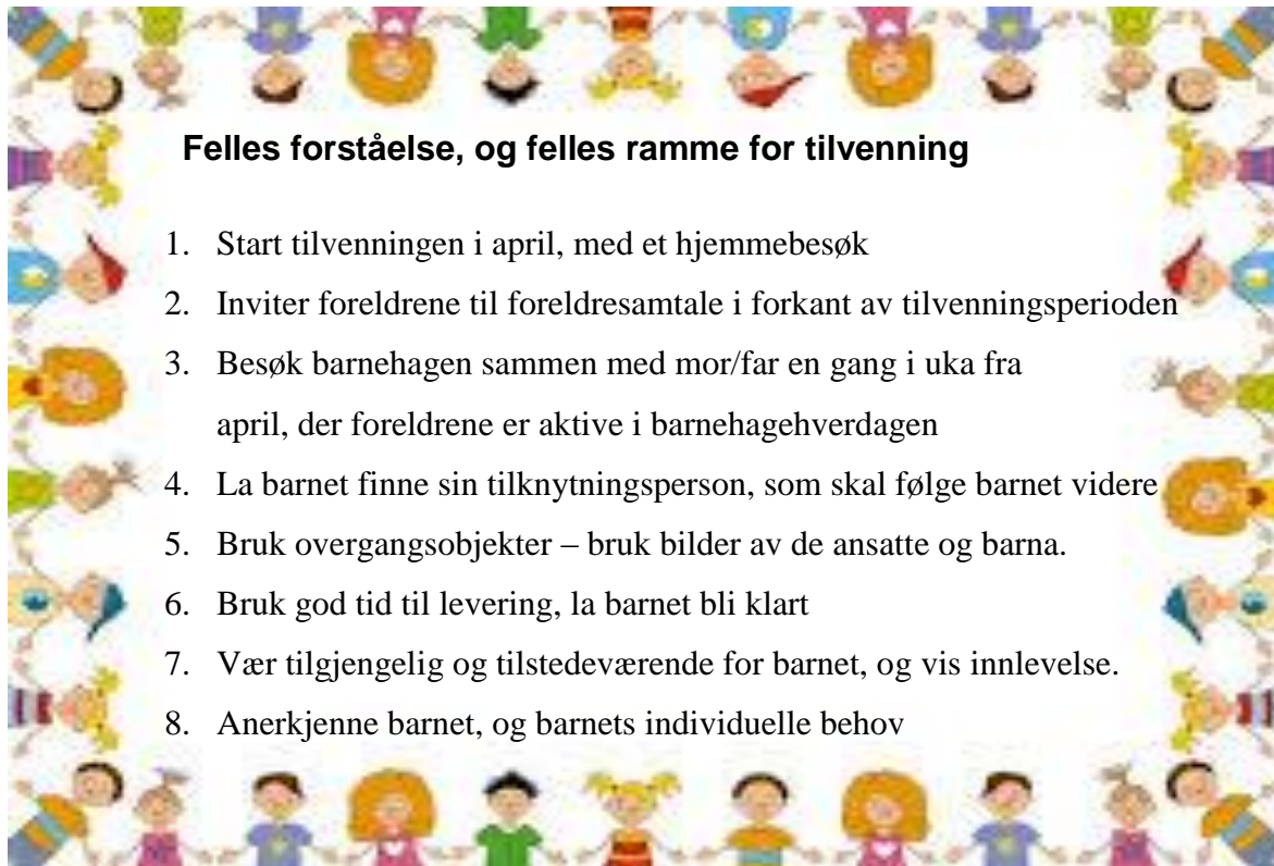
Figur 2: Tilvenningsmodell. Denne modellen illustrerer hvordan en tilvenningsperiode kan legges opp, for at barnet skal få en så trygg tilvenning som mulig. (Taskerud, S. M. & Gjermundsen, U. N., 2017).

Denne studien har vært krevende, lærerik og en inspirasjon til videre arbeid. Gjennom forskningen har vi blitt inspirert av den danske forskningen om tilvenningen, og vi ønsker å foreslå en modell for barns tilvenningsperiode i barnehagen.