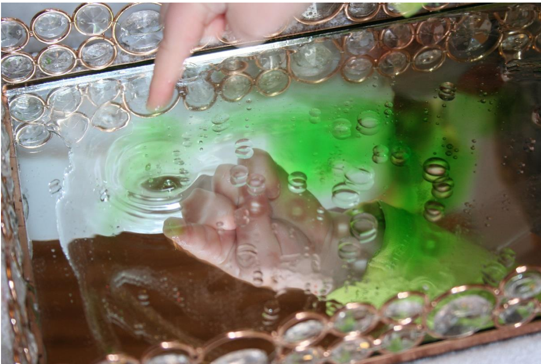
Inntrykk og uttrykk med olje, vann og speil