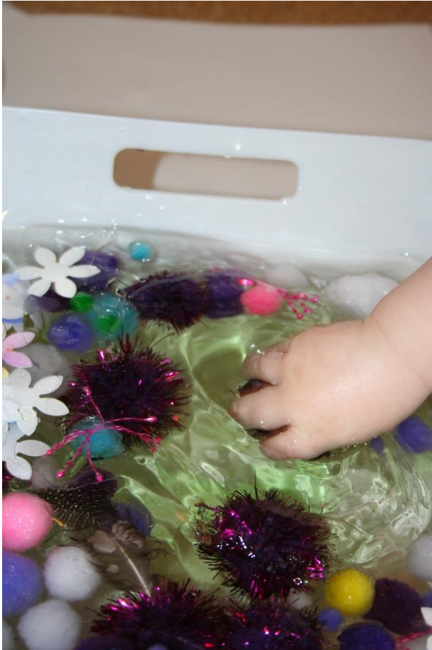
Inntrykk og uttrykk i vann