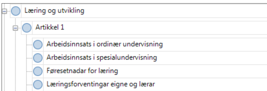
Figur 2 Utsnitt av undernodar i artikkel 1

Det tredje steget var då sjølve kodinga av datamaterialet. Kategoriane som kodinga bygde på vart utvikla deduktivt gjennom at dei var teoretisk utvikla i arbeidet med kunnskapsgrunnlaget både til studien sine overordna perspektiv og til dei ulike artiklane. Kodinga er knytt til kategorisering av empirien som gjengir informasjonen i kjeldene: «Coding is the ascription of a category label to a piece of data, that is either decided in advance or in response to the data that have been collected (Cohen mfl., 2011, s. 559). Eg gjekk gjennom kvar einskild kjelde og koda desse inn i dei eksisterande nodane i tråd med ei deduktiv tilnærming. Dette gav meg eit ryddig bilete av kva dei ulike kjeldene bidrog inn i forkinga med, og det var enkelt å kople dei saman for å få eit heilskapleg bilete av dei utvalde hovudnodane (hovudkategoriane i prosjektet).