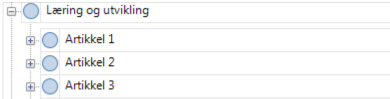
Figur 1 Hovudnoden «Læring og utvikling»

Undernodane vart då konkretisert inn mot det artikkelen skulle seie noko om (sjå utsnitt i fig. 2).