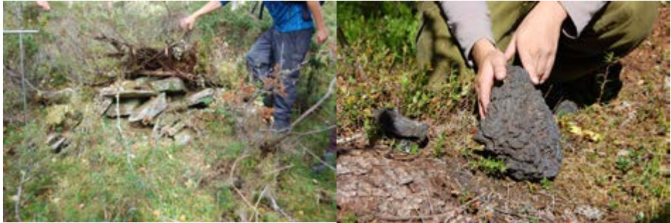
Bilde 1: Sammenrast ovn øst for Øverdalssetra, Bilde 2: Slagg fra Øverdalssetra