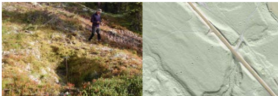
Bilde 5: Kvalitetssikring av fangstgrop.

lokaliteter for framstilling av jern, mens det langs Rv. 27 over Venabygdsfjellet finnes større rekker med fangstgroper for villrein. Sistnevnte fangstgroper var allerede lagt inn i Askeladden da feltarbeidet ble gjennomført, mens de fleste objektene i Veslegrytdalen foreløpig ikke er kvalitetssikret og dermed ikke «offisielt» registrert. Avslutningsvis skal nevnes at registreringene på de ulike lokalitetene i kommunen har foregått i et positivt samarbeid med de respektive grunneierne. Flere har tydelig satt pris på at det på «deres eiendom» finnes kulturminner av til dels svært stor verdi. Det er også i hovedsak gjennom grunneierne vi har fått informasjon om at det finnes interessante «objekter» på de angitte stedene. Feltarbeidet utført av studenter fra HH Evenstad har som oftest ført til at flere nye objekter er funnet.