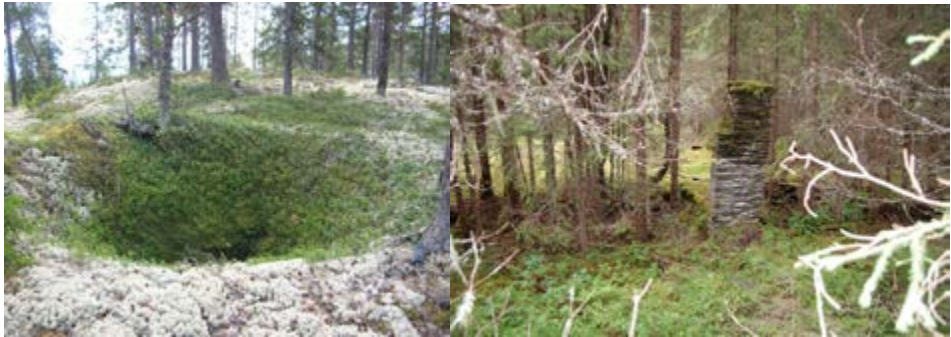
Bilde 3: Fangstgrop ved Kjølssjøen, Bilde 4: Hustuft i Imsdalen.

Imsdalen og Kjølssjøen øst for Atna er to andre områder hvor det har vært utført registreringer flere ganger. Bakgrunnen er som nevnt at metodikken ved registreringsarbeidet har endret seg noe over tid, eksempelvis ved at laseropptak fra fly har blitt brukt aktivt som en del av forarbeidet ved 2. gangs registrering (se Bilde 6). Begge områdene kjennetegnes ved et stort antall fangstgropene for elg, i tillegg til at det også i disse områdene finnes spor etter jernutvinning. Flere av fangstgropene ved Kjølssjøen er svært store og relativt godt bevart (Bilde 3), mens Imsdalen også har rester av skiferanlegg for blant annet takteking og hustufter fra nyere tid (Bilde 4).