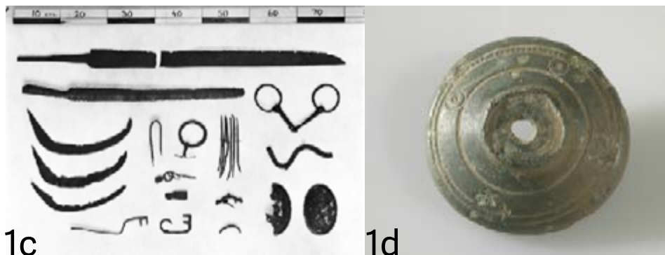
Figur 1: Løsfunn fra Stor-Elvdal, a - d (Kilde: unimus.no/arkeologi, unimus.no/foto/)

Det er ellers interessant å merke seg at Fosvold (1936) allerede for snart 80 år siden omtalte mangelen på kunnskap for denne delen av kommunens forhistorie. [Det er] ”beklagelig at de arkeologiske forhold i Østerdalen (...) er så lite klarlagt av videnskapen som tilfelle er, særlig det som angår veidekulturen og veidesamfundet. Her har vi (...) tusener av elgsgraver, men til dato har ikke videnskapen ofret noe for å få denne rikdom av historiske minner kartlagt, til tross for at disse meget talende oldtidsminner så å si daglig skrumper inn eftersom rydning og dyrkning av mark og skog går frem.” Uten å gå nærmere inn på en slik diskusjon kan kanskje dette utsagnet være en liten tankevekker, også med tanke på dagens situasjon.