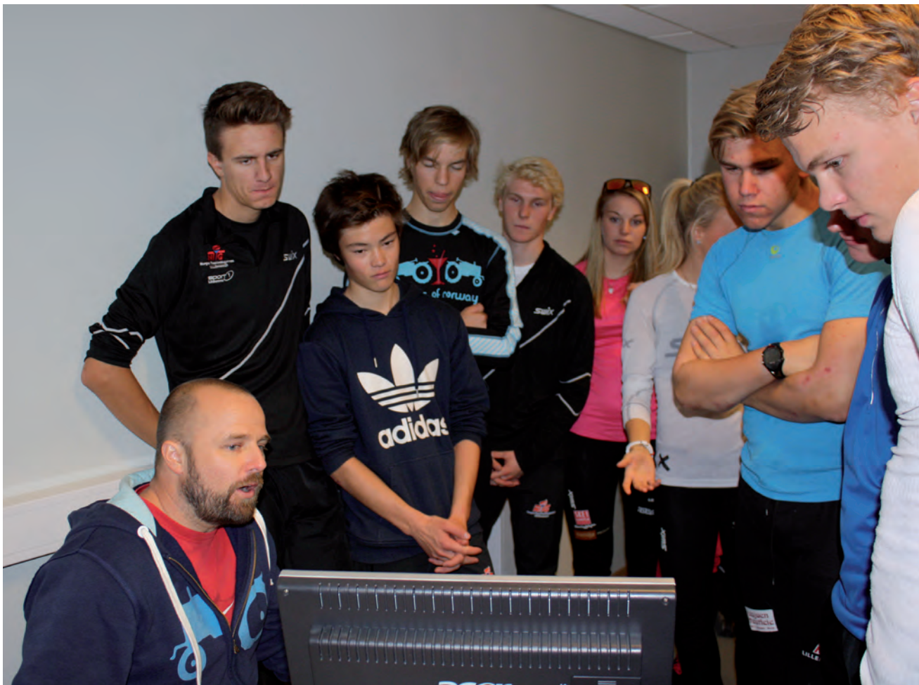
Fra aktivitetsdager på idrettslabben om sammenheng mellom kraft, tid og hopphøyde: Elever fra 3. klasse videregående skoler er spesielt invitert av seksjon for idrettsvitenskap ved Høgskolen i Lillehammer. Erfaring fra gymtimene og kunnskaper fra fysikktimene ble utgangspunktet for teori og praktiske øvelser.