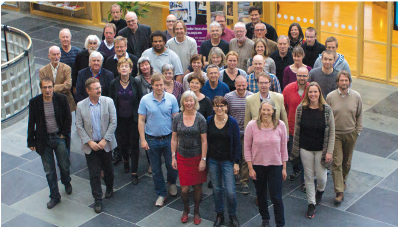
HiL har 188,5 årsverk i faglige stillinger, dette er noen av personene som utgjør disse årsverkene.

del tilfeller prestere bedre enn hva hver enkelt kan på egen hånd. Velfungerende forskningsgrupper og forsknings-sentre vil kunne bedre mulighetene for økt eksternt finansiert forskning (som fra Norges forskningsråd og EU) og i bestrebelsene for å kvalitetssikre forskningsarbeider, etablere internasjonale faglige nettverk og for å integrere nye medarbeidere.