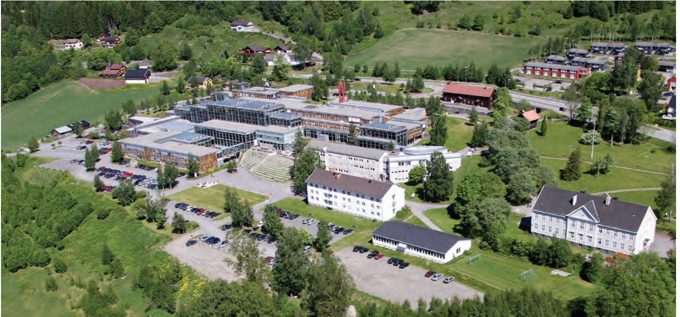
Høgskolen i Lillehammer holder til på Storhove omlag 5 kilometer nord for Lillehammer sentrum.