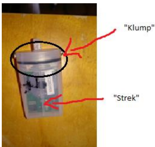
Figur 1 Hobo Pendant G logger

Datasettene behandlet jeg i Excel 2010 (Microsoft Corporation, Redmond, WA). Der ble det brukt t-tester for statistisk analyse. For å finne antall liggeperioder og lengdene på disse, ble alle liggeperioder mindre enn to minutter sammenhengende, kuttet vekk. Dette fordi det kan ha vært løft på beinet eller lignende i registreringsøyeblikket (Endres & Barberg, 2007; Ito et al., 2009; Mattachini et al., 2013).