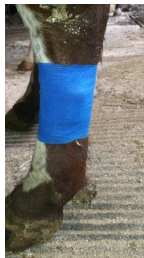
Figur 2 Logger festet med selvklebende bandasje