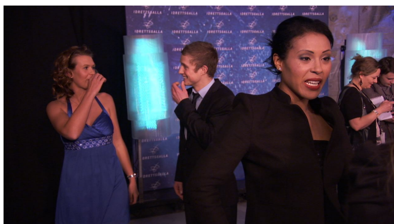
bilder fra råmateriale til "Verdensmestrer"