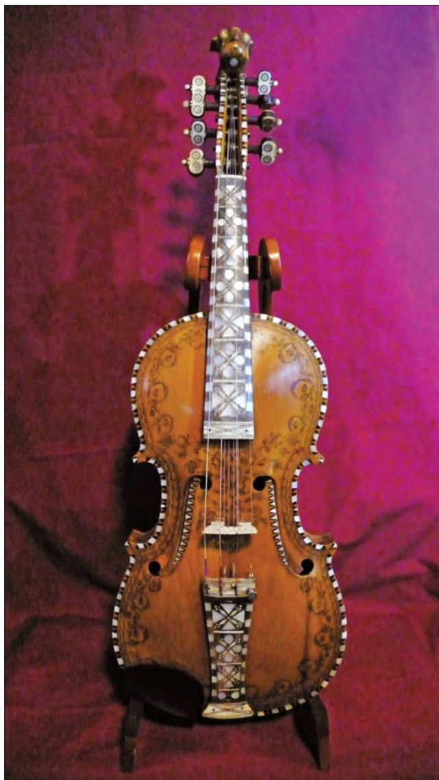
Hardingele laga av Aasmund Sandland, 1915. Rosa i ein variant av Hellandstilen. I forfattarens eige.