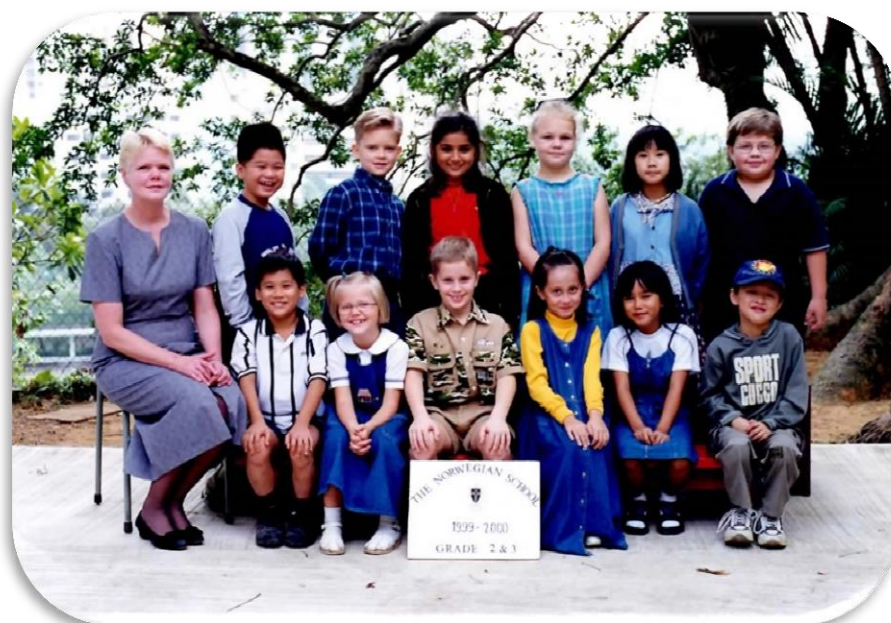
1.0. Klassebilde fra The Norwegian International School in Hong Kong

Samtykker til utlån hos høgskolebiblioteket