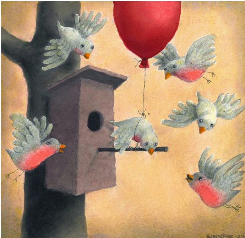
Illustrasjon: Eldbjørg Ribe